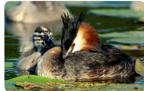
fol. Rafat Mencil