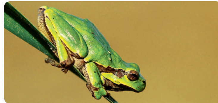
fol. Rafat Mencil