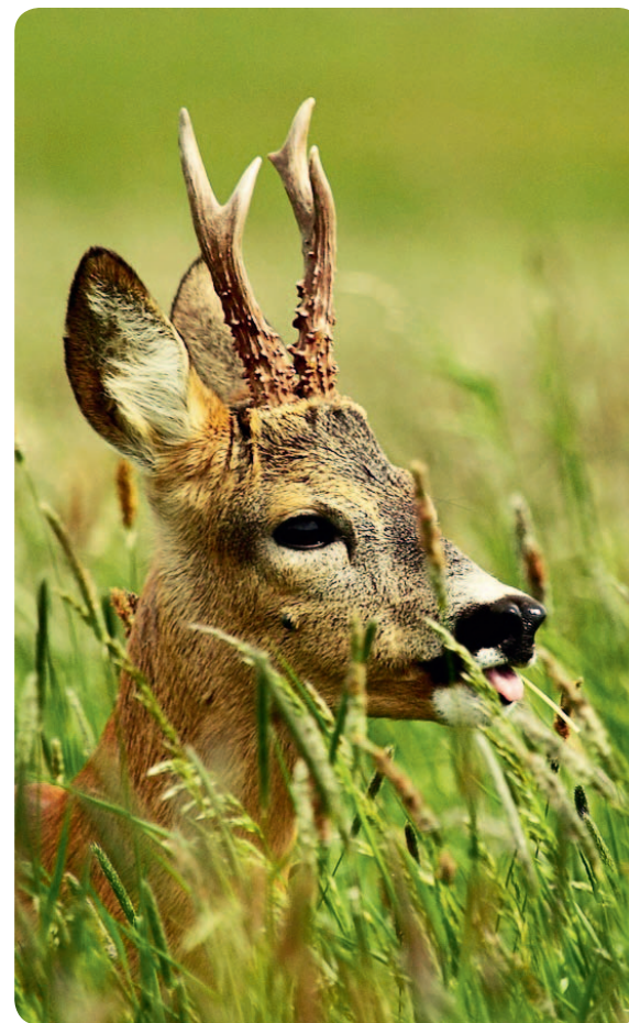
fol. Rafat Mencil

Obszerne tereny leśne, jeziora i rzeki sprawiają, że fauna tego regionu jest bogata. Pośród ssaków spotkać tu można m.in. sarny, daniela, jelenie, dziki, lisy, zające, łosie, wydry, borsuki, a także będące pod ochroną łasice, gronostaje i bobry. Z ptaków żyją tu m.in. różne gatunki ropsów, kumaki nizinne, grzebiuszki ziemne, a z gadów – jaszczurki, zaskrońce i żmije zygzakowate. Jeziora i rzeki bogate są w ryby - m.in. okonie, leszcze, sandacze, sumy, węgorze, szczupaki, sielawy, amury.