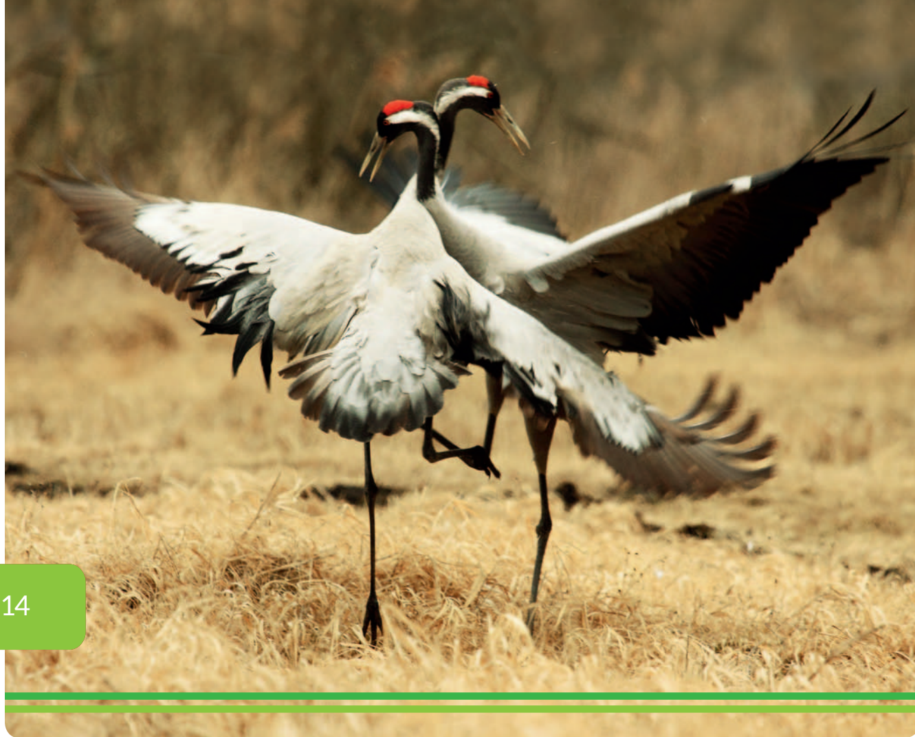
fol. Rafat Mencil